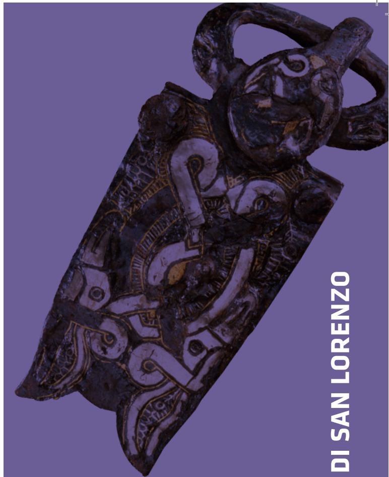
CHIESA PALEOCRISTIANA DI SAN LORENZO